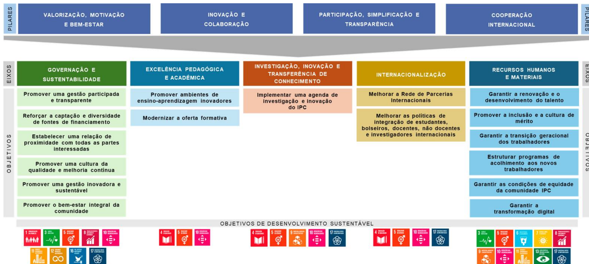
Figura 3 – Mapa Estratégico do IPC 2025-2029