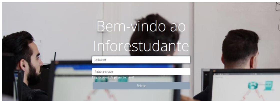
Figura 1 - Ecrã de Autenticação

Aceda ao link https://inforestudante.ipc.pt e proceda à autenticação.